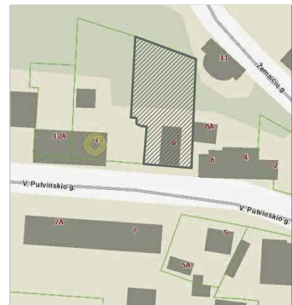
Projektuojamo sklypo situacija