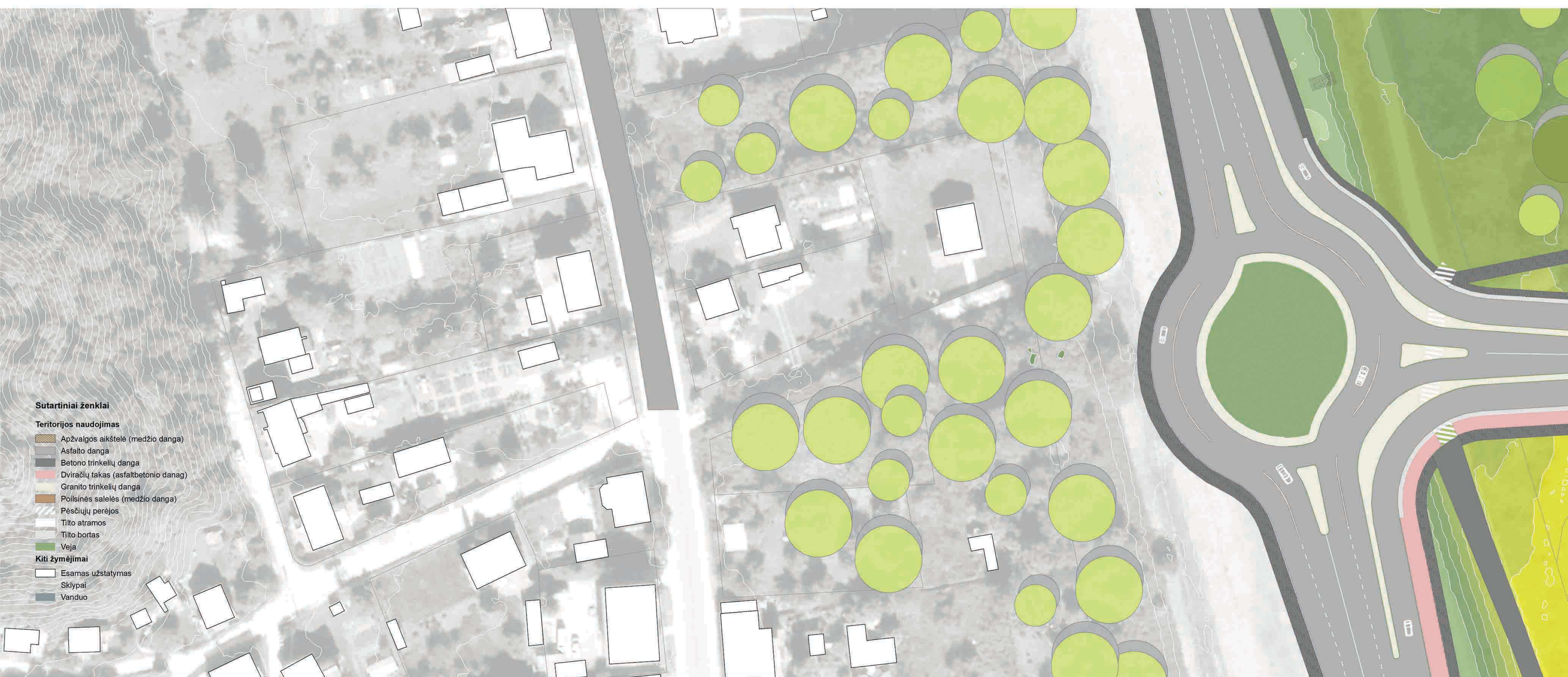
TILTO IR PRIETILČIO ARCHITEKTŪRINIS PLANAS M 1:500