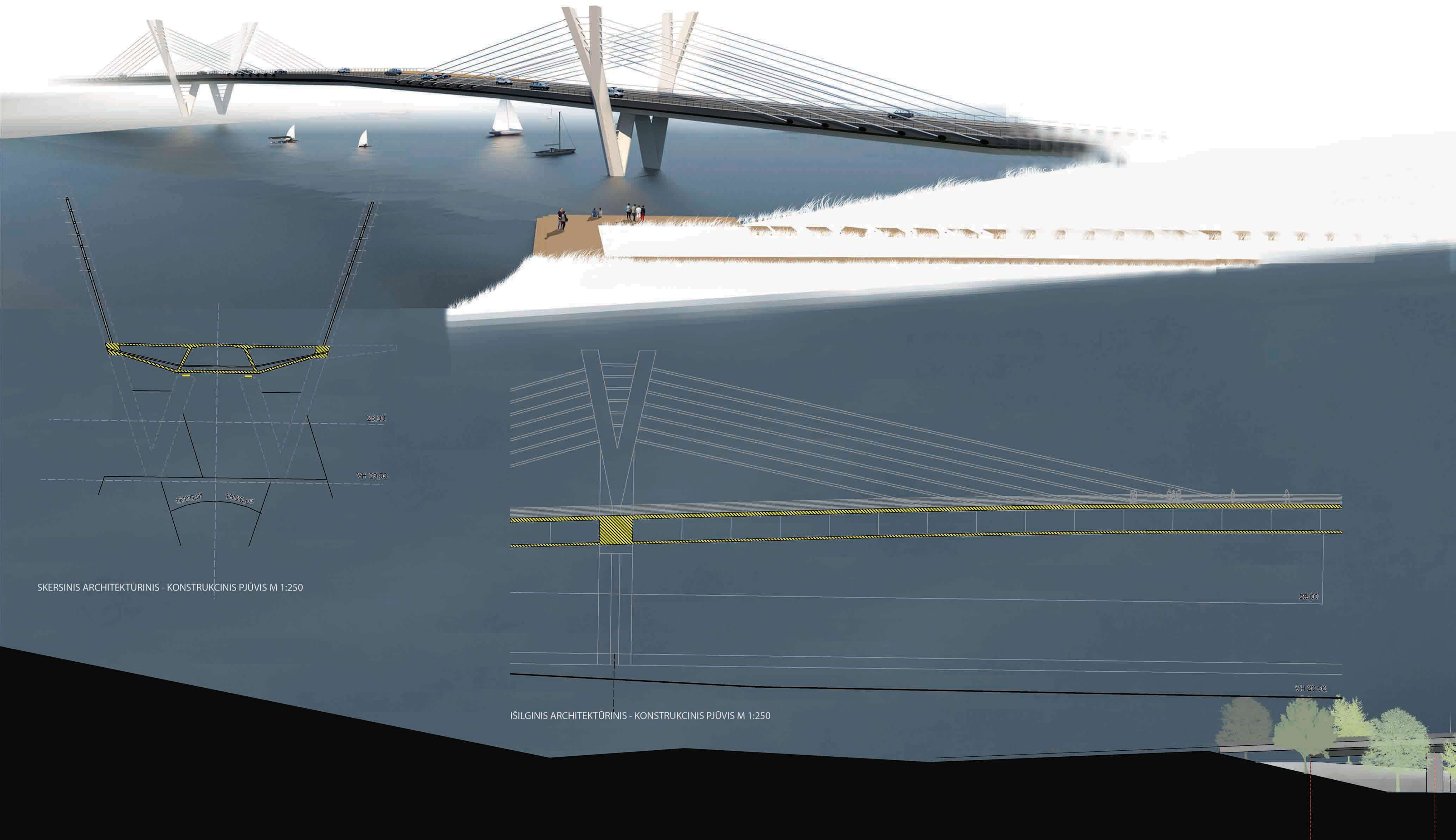
TILTO FASADAS M 1:500