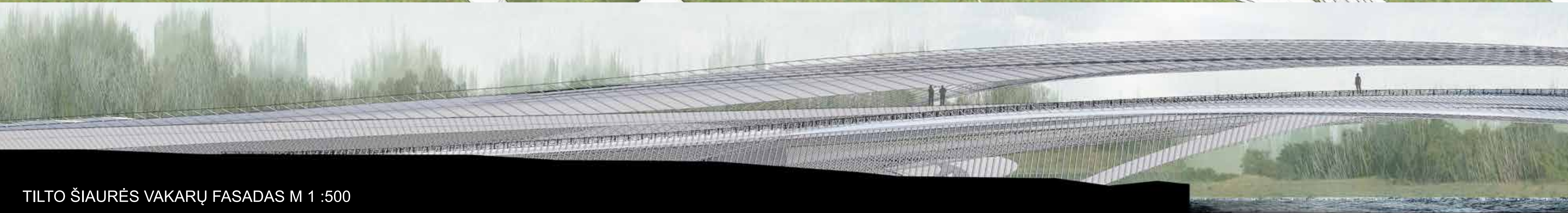
TILTO ŠIAURĖS VAKARŲ FASADAS M 1 :500