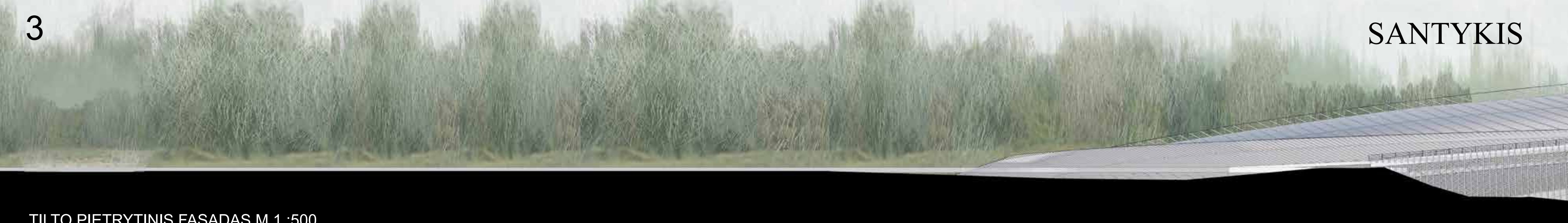
TILTO PIETRYTINIS FASADAS M 1 :500