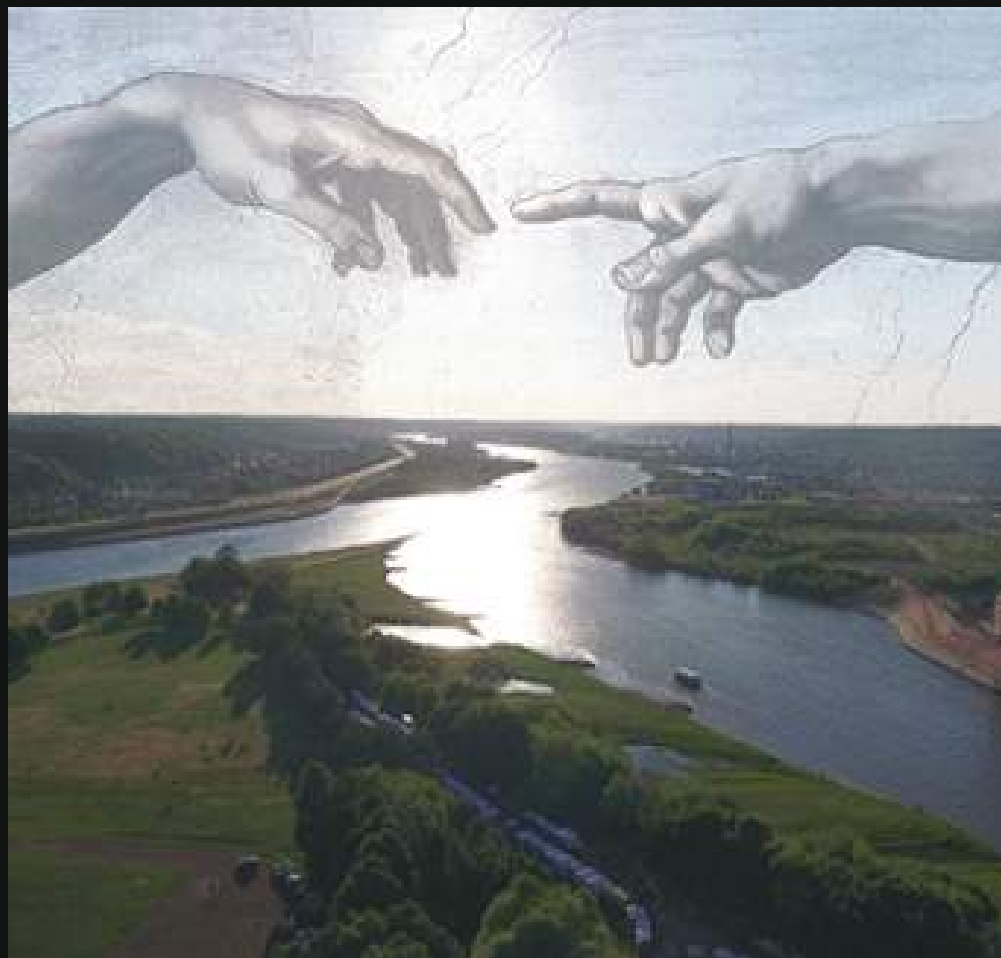
KĖDAINIŲ TILTO PROJEKTO ARCHITEKTŪRINIAI PASIŪLYMAI