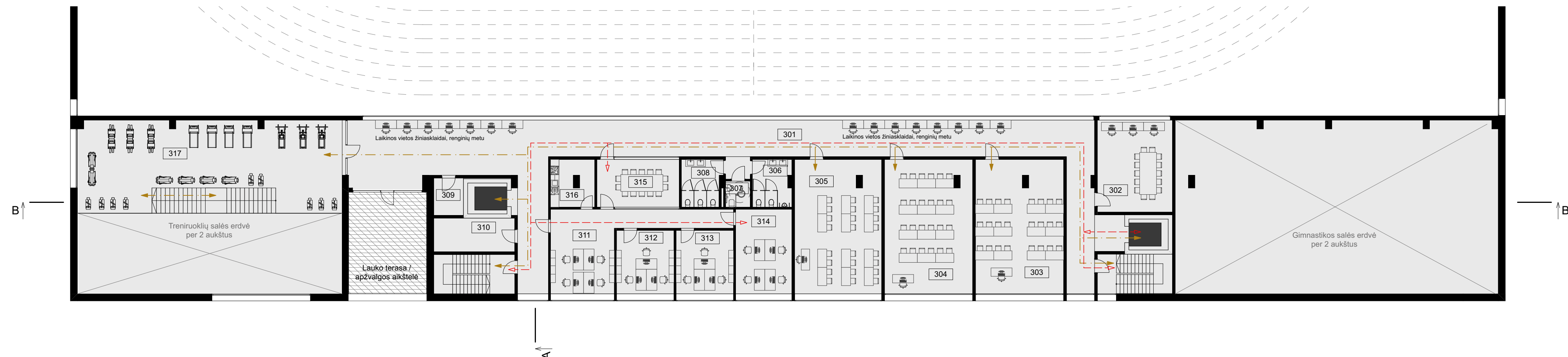
ANTRO AUKŠTO PLANAS M 1:200

3 AUKŠTO PATALPŲ EKSPLIKACIJA NR. PATALPA PLOTAS 301 Koridorius 305,52 302 Medijų techninė patalpa 34,95 303 Auditorija 60,10 304 Auditorija 60,10 305 Auditorija 60,10 306 WC 9,56 307 WC 3,25 308 WC 9,51 309 Pagalbinė patalpa 5,61 310 Pagalbinė patalpa 13,80 311 Kabinetas 38,81 312 Kabinetas 18,51 313 Kabinetas 18,51 314 Kabinetas 24,10 315 Pastatarinių salė 19,93 316 Polisio patalpa 10,68 317 Treniuoklių sala 109,09 Gimnastikos salės erdvė per 2 aukštus 802,13 m²