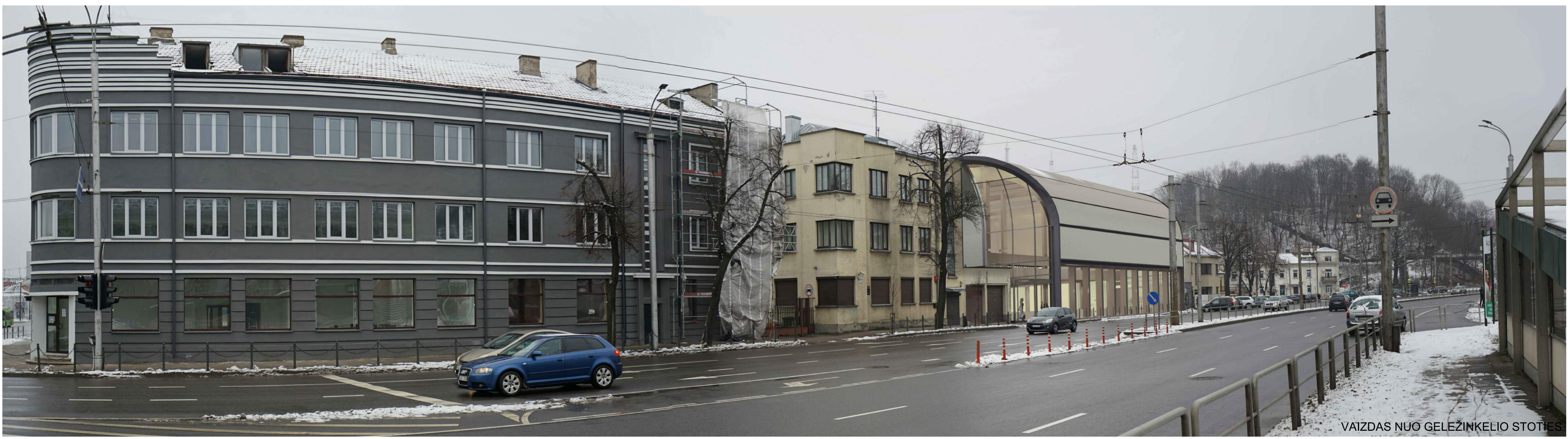
VAIZDAS NUĢ ĢELEŽĪNKELĪO STOTĪES

ĪSĪEKĪNT ĪŠĻĀIKYĪTĪ TURGĀVIETĒS SPECĪFĪNES FUNKCĪJOS ATPĀŽĪSTĀMŪMĀ, KĀĪP PROTOTĪPĀI NAUJO PAVILJONO ARCHĪTEKTŪRĪNĒI ĪŠRAĪŠKĀI PĀSĪRĪNKĪTĪ TURGĀVIETĒŪ ĢĀĻĪŪ PĀSTĀTĀMĀS BŪDĪNGĪ ARĪNĪAI ELEMĒNTĀI, DĪDĒĻĒS SVĒSĪOS ERDVĒS, PASAŽĪNĒ STRUKTŪRĀ, ĪSĪEKĪME, KĀD PAVILJONO PĀSTĀTO TŪRĪS ŠĪUOLĀIKĪŠKĀI ĪNTERPRETUŪTŪ PER ĻĀIKĀ SŪSĪFORMĀVĪSĪAS ŠĪOS PĀSKĪRTĪES STATĪNĪMĀS BŪDĪNGĀS ARCHĪTEKTŪRĪNĒS ĪŠRAĪŠKOS SAVĪBĒS, DARNĪAI ĪSLĪEDĀMĀS Ī NAUJĀMĒSĪCĪO URBĀNĪSTĪNĒI ŪZSTATĪMĀ.