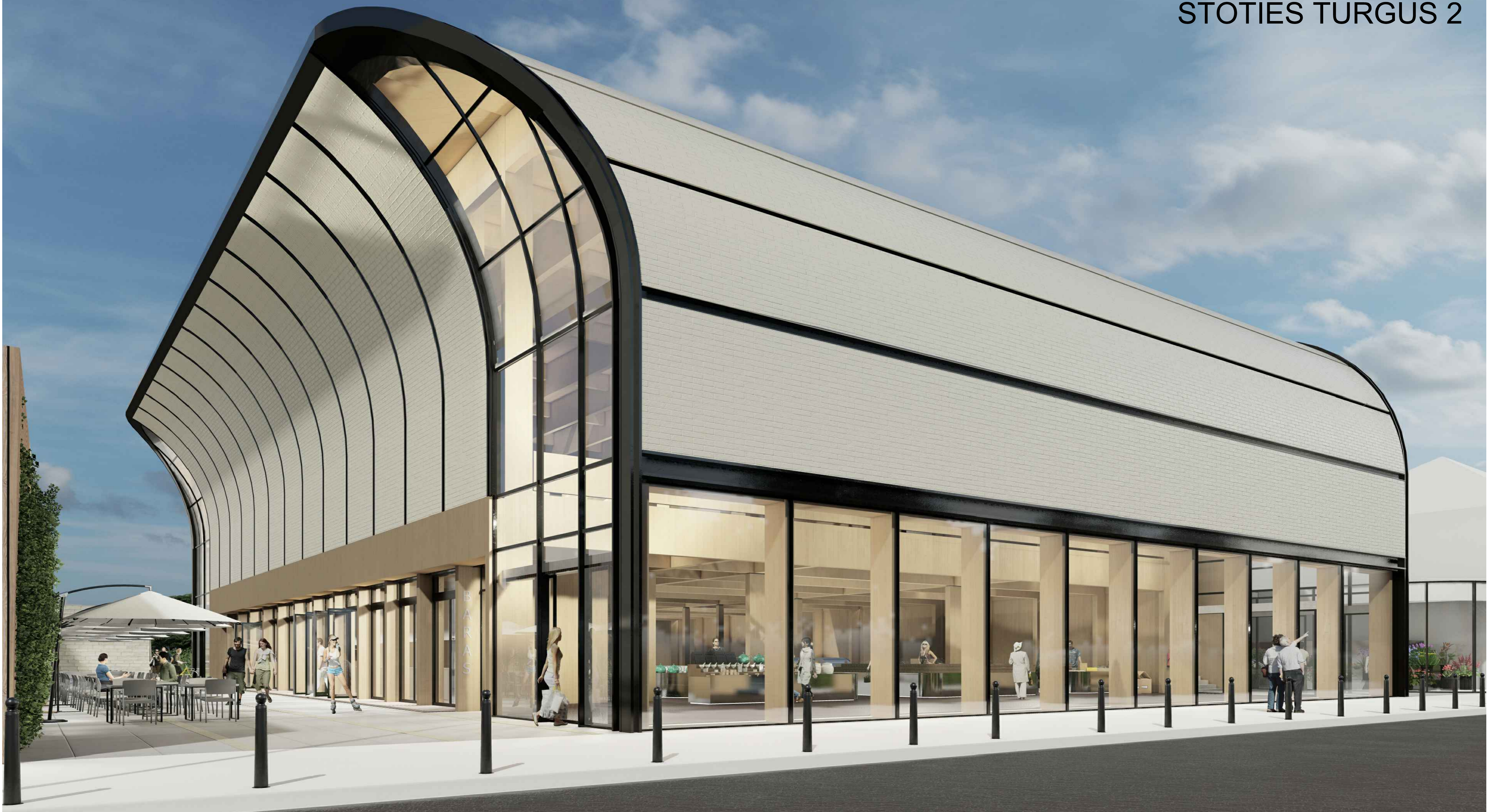
VAIZDAS NUO M. K. ČIURLONIO G.